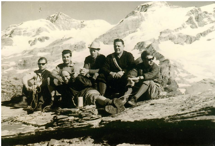
COURSE D'ETE 8 au 11 septembre 1966 CABANE GNIFETTI Mt. Rose